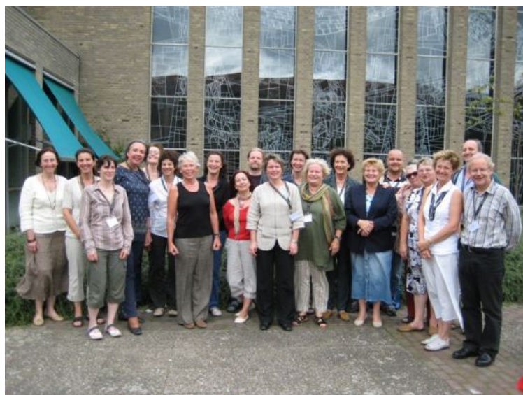
The European Music Therapy Committee